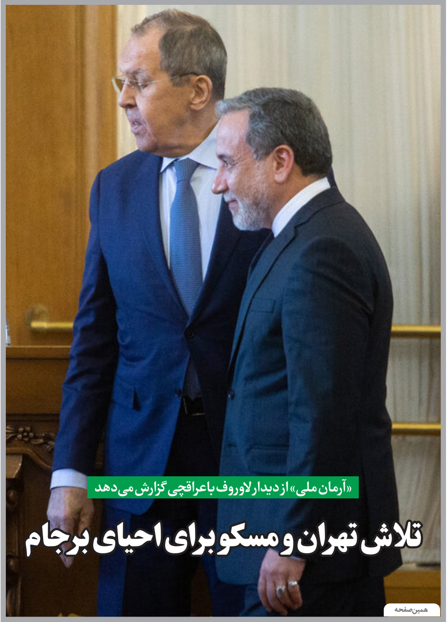
«آرمان ملی» از دیدار لاوروف با عراقچی گزارش می دهد تلاش تهران و مسکو برای احیای برجام همین صفحه

در پنج ماه گذشته مدارس حداقل ۳۵ روز تعطیل بودند آسیب دانش آموزان از تعطیلی مدارس آرمان ملی: اگر یادتان باشد، با شروع دوره همه‌گیری کرونا بود که تعطیلی مدارس به شکل دنباله‌داری مطرح شد و برگزاری کلاس‌های آنلاین از همانجا شکل گرفت. کلاس‌های آنلاینی که خود با چشمان خود می‌دیدم که دانش‌آموزان با چه ترفندهایی معلم را به اصطلاح خودشان می‌پیچانند! صفحه ۹