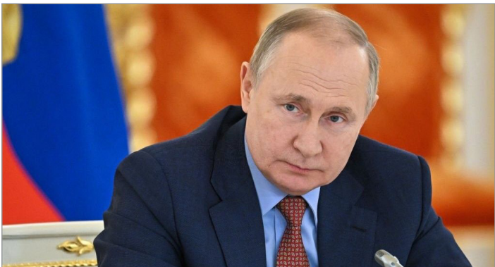
عملیات ویژه به ۴۰ میلیارد دلار می‌رسد. در همین ارتباط، وزارت دفاع آمریکا (پنتاگون) جدید کمک نظامی ۱.۲ میلیارد دلاری را به

اوکراین اختصاص داد. واشنگتن ۱.۲ میلیارد دلار کمک نظامی جدید را به اوکراین برای تقویت دفاع هوایی این کشور و تامین نیازهای مهمات توپخانه‌ای اختصاص داده است. از سوی دیگر، «کوبین مک کارتی» رئیس مجلس نمایندگان آمریکا هم با وجود تنش‌های درون حزبی جمهوریخواهان بیشتر موافقت خود را با کاهش هزینه‌های نظامی آمریکا اعلام کرده بود. درحالی‌که اوکراین بارها و بارها از مذاکره با روسیه سرباز زده است، مسکو تاکنون به دفعات آمادگی خود برای گفت‌وگو با اوکراین را اعلام کرده است. در همین ارتباط، بسیاری معتقدند که ارسال انبوه تسلیحات مرگبار از سوی کشورهای غربی برای مقابله با روسیه، مانع از آن می‌شود که کی‌یف با مسکو مذاکره کند.