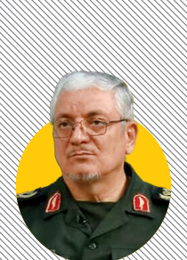
انتقاد عجیب سردار طلایی نیک

سخنگوی وزارت دفاع شاهنامه دوشنبه در مراسم یاد یاران شهرستان پاکدشت با اشاره به اقدامات اخیر دولت در یکبار چه رفقای که درباره لولایج مربوط به FATF رخ داد که چند سال است که این ها را نگه داشته اند، در حالی که یکی را مجلس تصویب کرد و شورای نگهبان هم تأیید کرد و یکی دیگر را مجلس تصویب کرد و شورای نگهبان هم اشکال گرفت که قابل رفع بود، بعد رفت در جمع تشخیص و هیأت نظارت، جلوش را گرفتند. اگر تصویب می شد چقدر مؤثر بود در وضع اقتصاد کشور؟! خوب، این نشان می دهد که آن تصمیم گیرنده نهایی مجلس نیست.