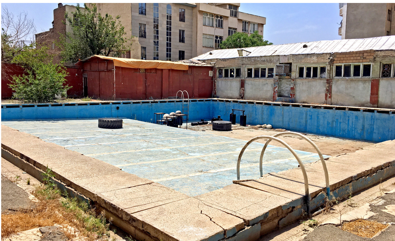
استخرهای میدان بهارستان، یادگار دوران پهلوی است.

علی نصیریان، بازیگر پیشکسوت سینما و تلویزیون عنوان کرد که تمام عمر خود را برای بازیگری گذاشته است. نصیریان، بازیگر پیشکسوت سینما و تلویزیون عنوان کرد که تمام عمر خود را برای بازیگری گذاشته است. نصیریان، بازیگر پیشکسوت سینما و تلویزیون عنوان کرد که تمام عمر خود را برای بازیگری گذاشته است. نصیریان، بازیگر پیشکسوت سینما و تلویزیون عنوان کرد که تمام عمر خود را برای بازیگری گذاشته است.