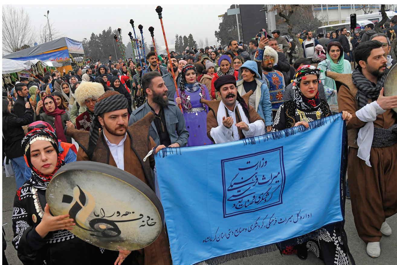
هجدهمین نمایشگاه بین‌المللی گردشگری و صنایع دستی ایران-تهران ۱۴۰۳