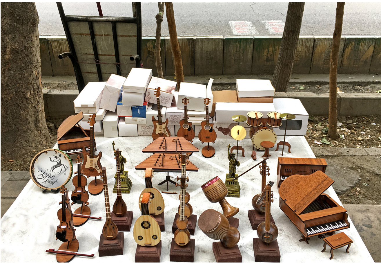
موسیقی نیاز روحی انسان مدرن است، لحظه‌ای برای آرامش و تمدد اعصاب. وقتی به ماکت هر ساز نگاه می‌کنیم تا خودآگاه طنین صدایش همراه با خاطره‌ای در ذهنمان دوباره به جریان می‌افتد. موسیقی فاخر ایرانی را پاس بداریم.