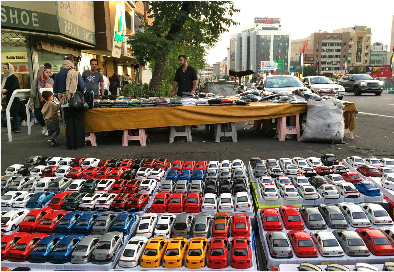
پیاده روهای خیابان ها در تسخیر دستفروشان. جای تأمل و تاسف دارد که هر روز بر تعداد دستفروشان خیابان وزیر زمین (متر) افزوده می شود.