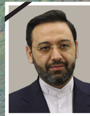
صفحات ۲ و ۱