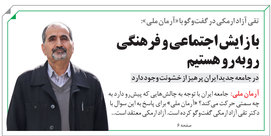
تقی آزادارمکی در گفت و گو با «آرمان ملی»:

ظریف در پاسخ به پرسش «آرمان ملی»: بعید است توافقی بهتر از برجام به دست آید