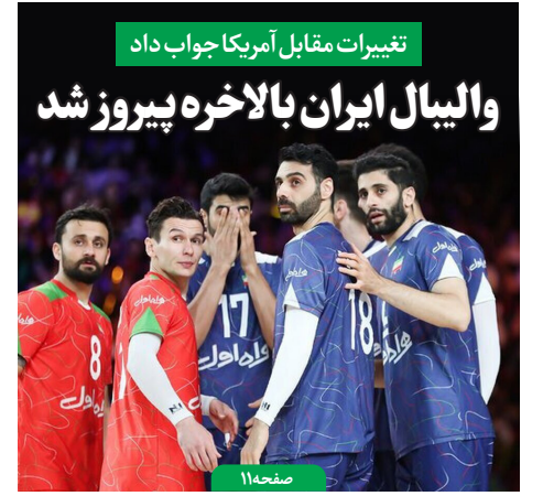
تغییرات مقابل آمریکا جواب داد والیبال ایران بالاخره پیروز شد