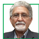
پی اله عشقی نانی