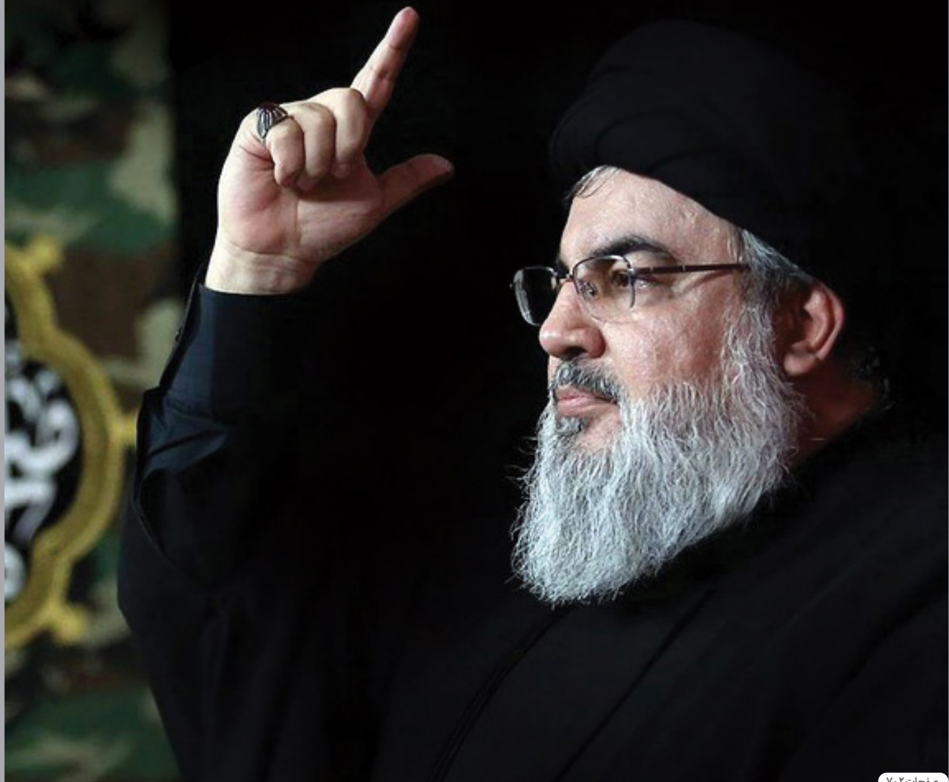
صفحات ۲ و ۷

۵ روز عزای عمومی در ایران؛ ۳ روز در عراق و لبنان