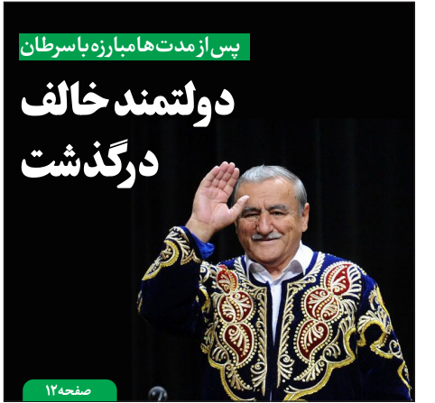
پس از مدت‌ها مبارزه با سرطان