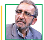
مجدد اهری آسیب شناس