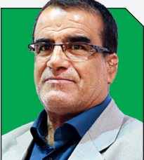
علی محمد نمازی: اصلاح‌طلبان باید از رقابتی بودن انتخابات مطمئن شوند

مرکز رسانه قوه قضاییه روز گذشته اطلاعیه جدیدی درباره اکبر طبری صادر کرد که در آن آمده است: با پذیرش اعاده دادرسی اکبر طبری مطابق ماده ۴۷۴ قانون مجازات اسلامی و قانون ۵۲۰ کیفری پرونده به شعبه ۱۵ دادگاه کیفری یک تهران ارجاع داده شد. بعد از ارجاع پرونده از دیوان عالی کشور به شعبه هم عرض این پرونده مجدداً رسیدگی و دادگاه، میزان قرار وثیقه قبلی طبری که ۱۰۰ میلیارد تومان بود را افزایش و به ۳۰۰ میلیارد تومان تغییر داد تا وی با سپردن وثیقه تا رسیدگی نهایی و صدور رای قطعی از زندان آزاد شود. طبق آخرین پیگیری‌ها، حکم پرونده اکبر طبری مدتی پیش در شعبه هم‌عرض مجدداً صادر و وی به مجازات حبس محکوم شده است.