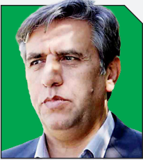
محمدصادق جوادی حصارز اصلاح‌طلبان با حاکمیت گفت‌وگو کنند

تمامی اصلاح‌طلبان بپذیرند در انتخابات مشارکت کنند؛ شورای نگهبان کسی را در صلاحیت نکند؛ مردم متقاعد شوند؛ لازم است در انتخابات شرکت کنند؛ تمام کسی‌های مجلس آینده در اختیار اصلاح‌طلبان قرار بگیرد؛ انتخابات بدون هیچ حاشیه‌ای برگزار شود و در نهایت اینکه لایح اصلاح‌طلبان توسط شورای نگهبان رد نشود. نگاهی به شروط حجاریان برخی نکات را یادآور