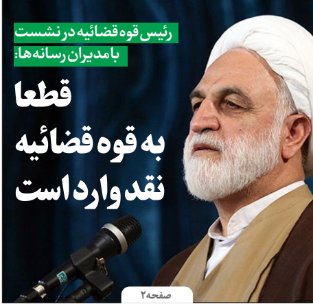
رئیس قوه قضائیه در نشست با مدیران رسانه ها: