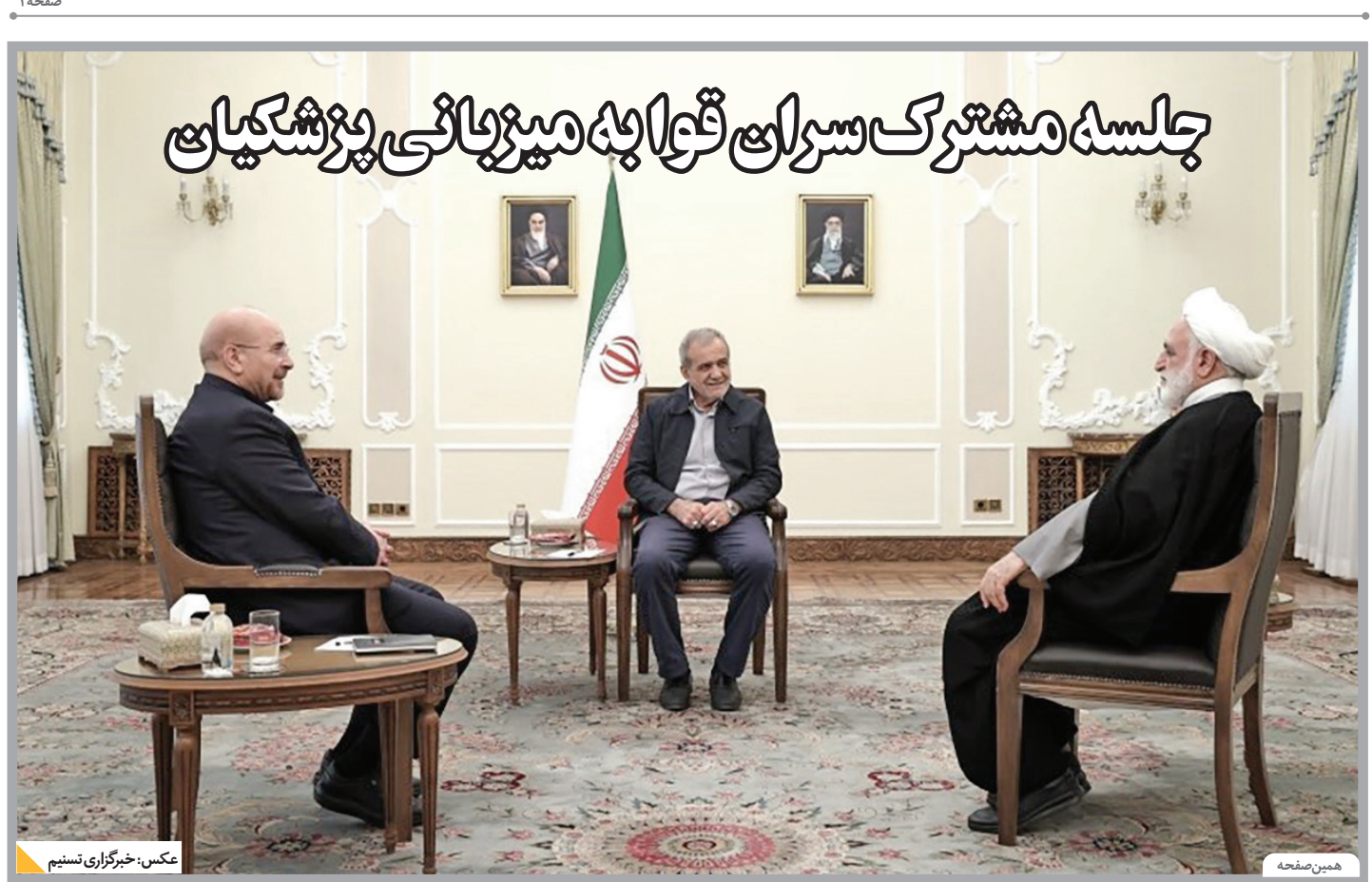
جلسه مشترک سران قوا به میزبانی پزشکیان

تندروهای خواهند اختیارات رئیس‌جمهور را هم مصادره کنند