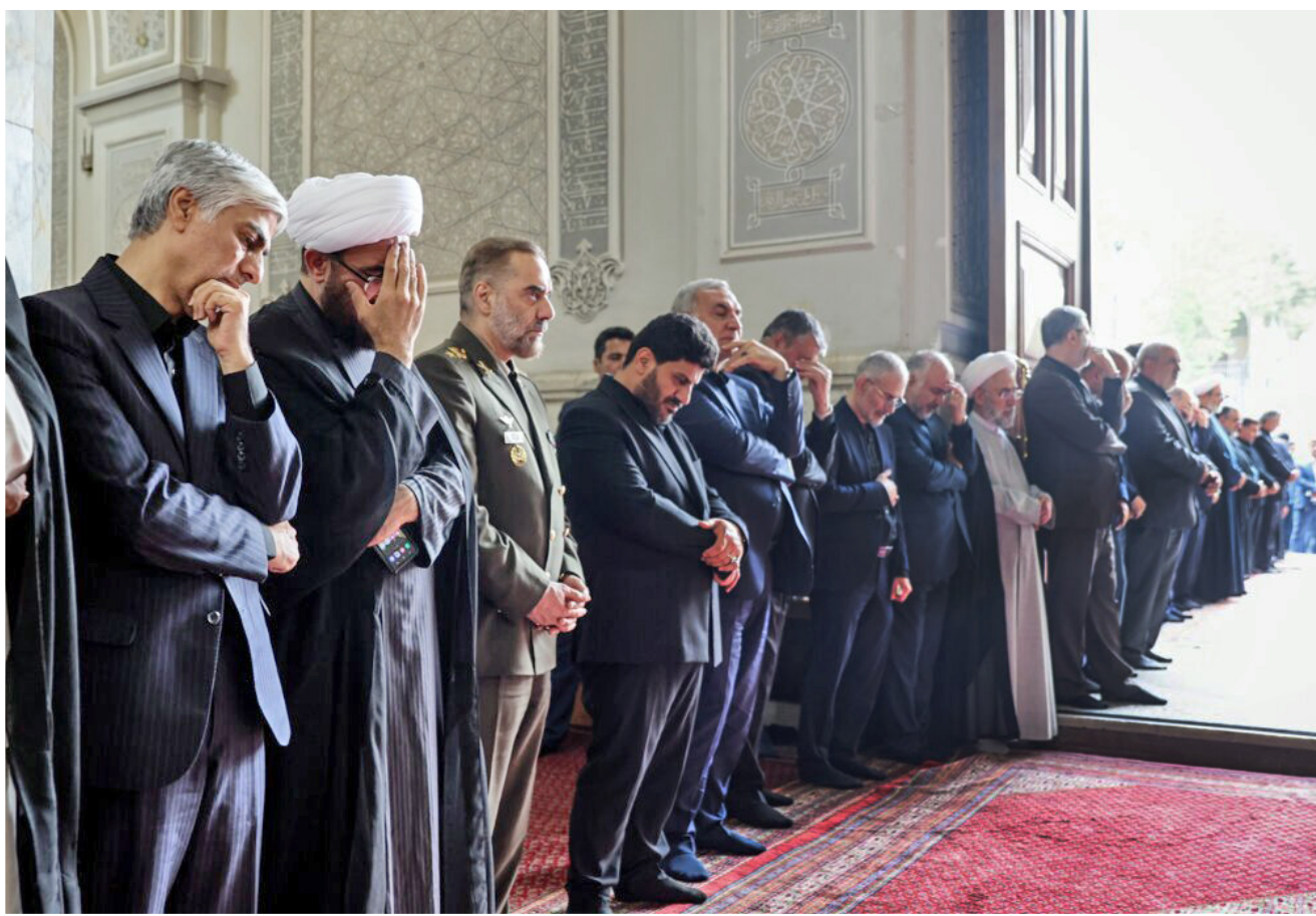
مراسم هفتمین روز شهدای خدمت، آیت الله «سید ابراهیم رئیسی» و همراهان، ظهر یکشنبه ۶ خرداد ۱۴۰۳ از سوی هیات دولت جمهوری اسلامی ایران در مدرسه عالی شهید مطهری برگزار شد.