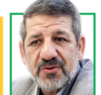
حسین کتانی مقدم تحلیلگر سیاسی