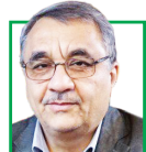
عبدالرضا فرجی راد سفیر سابق ایران نروژ و مجارستان