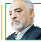
احمد دستمالچی سفر سابق ایران در بیروت