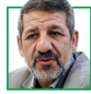
حسین کتانی مقدم فعال سیاسی اصولگرا