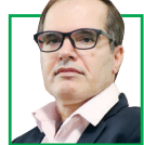
مرتضی مکی تحلیلگر سیاسی