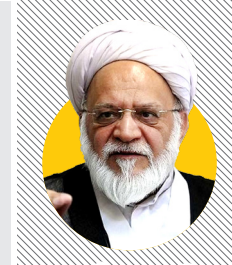
توصیه های انتخاباتی اصولگرایان

در متن لایحه که با تصویب دو فوریتی مجلس روبرو شد آورده شده «سازمان حمایت مصرف کنندگان و تولید کنندگان و شرکت بازرگانی دولتی ایران به همراه تمامی امکانات، تعهدات، وظایف و مأموریت ها، ساختار و نیروی انسانی و اموال منقول و غیر منقول آنها و کلیه وظایف و مسئولیت های حوزه بازرسی بازار، به ترتیب از وزارتخانه های صنعت، معدن و تجارت و جهاد کشاورزی منتزع و به وزارت ملحق می شود.» این ماده قانونی در صورت تصویب نشان می دهد نمایندگان مجلس در تشکیل وزارت بازرگانی مسئله کنترل قیمت ها خصوصا قیمت کالاهای وارداتی را در نظر دارند. بر همگان مسلم است که نظارت بر قیمت ها و کنترل آن هیچگاه با مبانی اقتصاد آزاد همخوانی ندارد و بارها این مورد پس از اجرا با عدم موفقیت هایی روبرو شده. مگر اینکه دولت و شرکت های دولتی خود به وارد کننده کالای مورد نیاز کشور تبدیل شوند که این مورد نیز خود بیانگر تورم دولت خواهد بود که با مبانی برنامه های توسعه در مخالفت آشکار قرار دارد. به نظر می آید در تصویب تشکیل وزارت بازرگانی چیزی جز واردات برای کنترل قیمت ها باید در نظر گرفته شود. این جمله مبانی صادرات کالاهای تولیدی، در غیر این صورت تشکیل وزارت بازرگانی جز اینکه واردات را تسهیل کرده و