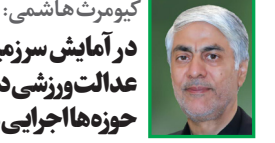
کیومرث هاشمی؛ در آمایش سرزمینی عدالت ورزشی در همه حوزه‌ها اجرایی می‌شود

وزیر ورزش و جوانان در نخستین جلسه ستاد عالی طرح تدوین آمایش سرزمین گفت: در تمامی بخش‌های ورزش می‌خواهیم آمایش سرزمین را اجرایی کنیم و این طرح می‌تواند هم‌افزایی را میان دستگاه‌ها ایجاد کند. کیومرث هاشمی در جلسه ستاد عالی طرح تدوین آمایش سرزمین اظهار کرد: از همه عزیزانی که در راستای اجرای این طرح تلاش می‌کنند، تشکر می‌کنم. این‌گونه جلسات می‌تواند در یک فضای تعاملانه ادامه داشته باشد. وزیر ورزش و جوانان ادامه داد: تصویرمقام معظم رهبری در جمع ورزشکاران والیبالیست دانش‌آموزی، نشان‌دهنده نگاه ویژه رهبری به ورزش و تربیت بدنی است و ما باید از این ظرفیت استفاده کنیم. نکات مقام معظم رهبری همیشه راهگشا بوده است و در طرح آمایش سرزمین قرار است عدالت ورزشی در همه حوزه‌ها صورت بگیرد.