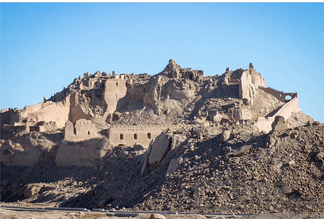
زمین‌لرزه‌ای با بزرگی ۶/۶ ریشتر که در ساعت ۵:۲۶ بامداد روز جمعه ۵ دی ۱۳۸۲ به مدت ۱۲ ثانیه شهر بم و مناطق اطراف آن در شرق استان کرمان را لرزاند. زمین لرزه بم بیشترین تلفات انسانی (حدود ۵۰ هزار نفر) را در میان تمام زمین لرزه‌های تاریخ ایران بر جای گذاشت.