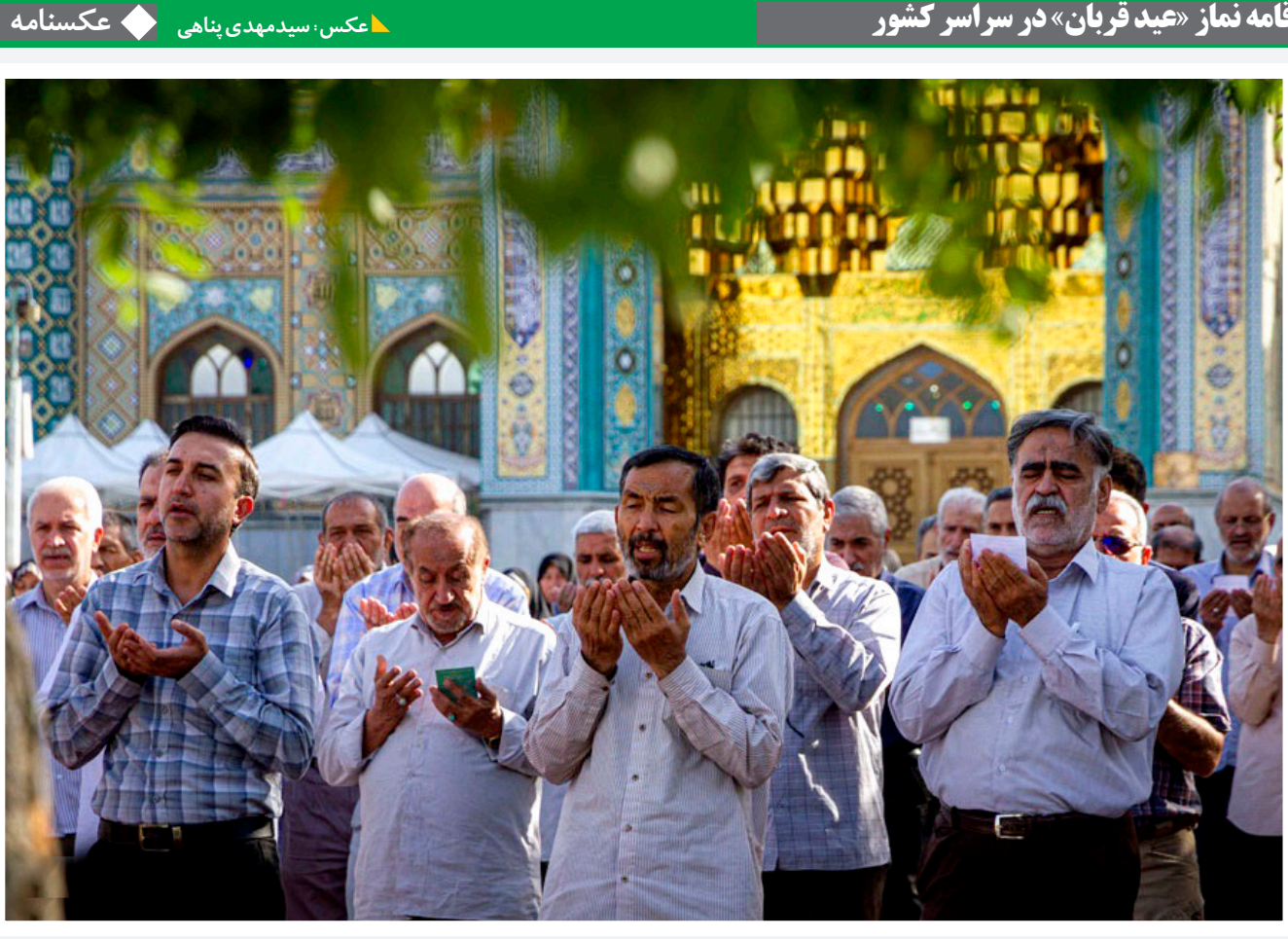
تکس، سید مهدی پناهی