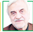
سیدمصطفی هاشمی طبا فعال سیاسی