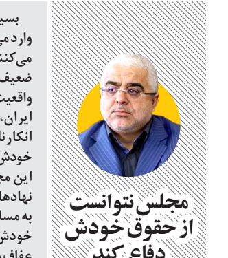
مجلس نتوانست از حقوق خودش دفاع کند