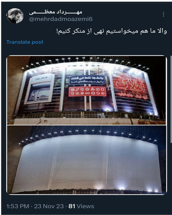
1:53 PM - 23 Nov 23 - 81 Views

کنایه دوپهلوی مدیر روابط عمومی اوج به حضور حجاب بانان و بنگاهداری بانک‌ها