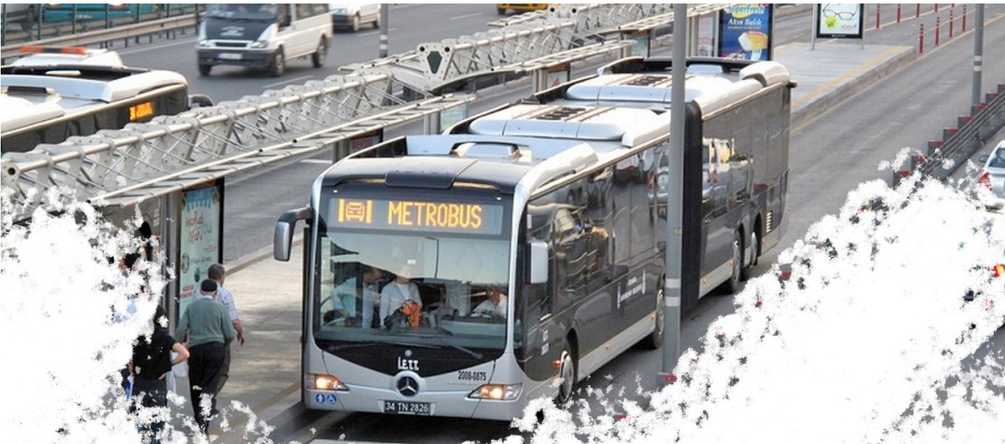
آقامیری، عضو شورای شهر تهران گفته متروباس ۱۳ اتوبوس به هم چسبیده‌اند و قرار داد خرید یکصد دستگاه آن بسته شده

سردار رضاطلایی‌نیک سخنگوی وزارت دفاع با اشاره به تهیه و تدوین دو لایحه درباره سربازی توسط این نهاد گفت: لایحه «مهارت‌آموزی سربازان» و «اصلاح قانون نظام وظیفه» هر دو در دستور کار دولت قرار دارند و ظرف یک یا دو ماه آینده به مجلس ارسال می‌شوند. سردار رضاطلایی‌نیک سخنگوی وزارت دفاع با اشاره به اقدامات این نهاد در حوزه سربازی گفت: در خصوص سربازی با هماهنگی ستاد کل نیروهای مسلح، دو لایحه را به دولت تقدیم کرده‌ایم. در این راستا، یک لایحه با نام «تقویت مهارت‌آموزی سربازان در دوره خدمت» در کمیسیون اصلی دولت تصویب شده است. او افزود: براساس این لایحه، قرار است امتیازاتی در حوزه آموزش و مهارت‌یابی در دوره خدمت با هدف استفاده بهینه از فرصت سربازی و همچنین حمایت‌ها و تسهیلات ویژه‌ای را به صورت قانونمند برای اشتغال سربازان پس از دوران خدمت وظیفه‌خواهی داشت.