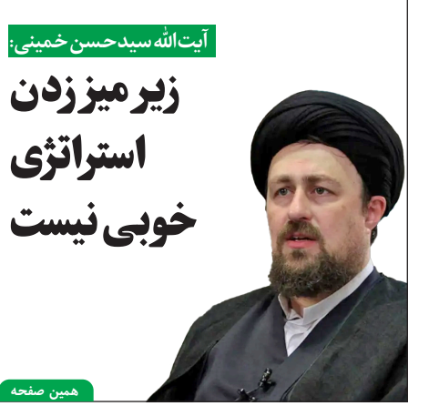
آیت‌الله سیدحسین خمینی: