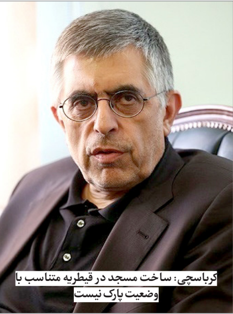
کرباسچی: ساخت مسجد در قیطره متناسب با وضعیت پارک نیست