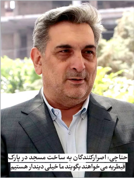
حناچی: اصرارکنندگان به ساخت مسجد در پارک قیطره می‌خواهند بگویند ما خیلی دیندار هستیم