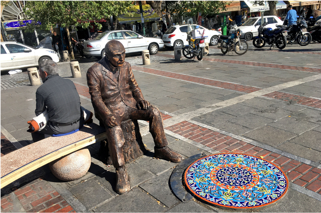
در هیاهوی شهر در میدان مسن‌آباد تهران مردی فلزی ساعت‌های زیادیست که یک نقطه فیره شده. انکار پوست انداختن شهر و آدم هایش را به نظاره نشسته است. برخی عابریان هم به او سلام می‌کنند و برایش دست تکان می‌دهند.