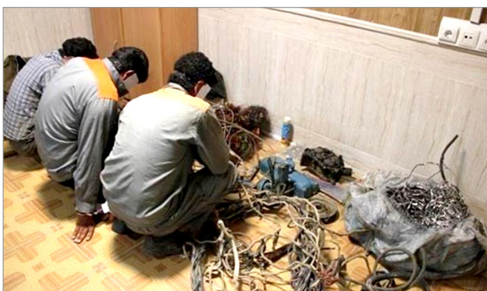
باربرسی های تخصصی و اقدامات هوشمندانه در چند عملیات دقیق و حساب شده آنها را پلیسی ۳ سارق را در ارتباط با این سرقت ها

در مخفیگاه‌هایشان دستگیر کردند. رئیس پلیس آگاهی استان اصفهان ادامه داد: پس از انتقال سارقان به پلیس آگاهی استان تحقیقات از آنها به صورت تخصصی انجام و متهمان به ۲ فقره سرقت تجهیزات دکل های مخابراتی و ۲ فقره سرقت از کارگاه های صنعتی شهر اصفهان به ارزش ۱۰ میلیارد ریال اقرار کردند. وی با اشاره به کشف مقادیری اموال مسروقه شامل ۲ دستگاه سنگ فرز، یکدستگاه دریل یکدستگاه هیلتی، ۴ عدد دوربین مدار بسته، ۴ عدد کپسول گاز و مقادیری کابل مسروقه در بازرسی از مخفیگاه متهمان، خاطر نشان کرد: مالباختگان این پرونده شناسایی و تحقیقات برای کشف سایر جرائم ارتكابی توسط این باند همچنان ادامه دارد.