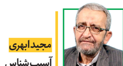
مجدد افسری اسیب شناس

شاد کردن دشمن نیاز به رفتارها و حرکاتی دارد که در هر جامعه با عنایت به زمان و فضای موجود متفاوت است. از نگاه رفتارشناسی اجتماعی شناخت دشمن خود دانش و معرفت جداگانه ای را می طلبد. با عنایت به هدف و غرض افراد ممکن است دشمنی به خاطر مادیات و تعلقات دنیوی آغاز شده و ادامه یابد. اینگونه دشمنی ها هیچگاه تمامی نداشته و همواره ادامه می یابد. دشمنی نوع دوم عداوت بر اساس توانمندی های سیاسی و قدرت اجرایی هستند که رقابت هر روز و هر ساعت بیشتر شده و در اجرای اهداف دشمنی افراد حاضر می شوند که فرد یا افراد مقابل را انتخاب کرده و اجازه ندهند برتری تحقق یابد. در سطح جامعه توطنه، شایعه سازی و دروغ پردازی از ابزار مقدماتی بوده و تا نابودی و ویرانه گشتن طرف مقابل تداوم می یابد. در دنیای حاضر توسل به تقلب به وسیله رایانه و ایجاد تصاویر قلابی و حقه های رایانه بسیاری از موانع ایجاد و با ورود به باند ها و شبکه های مافیایی دست به هرکاری می زنند. چه بسیار افراد خوشنام و معتمد که به وسیله همین روش های شیطانی بدنام شده و حتی به خودکشی و جلا و وطن کشانده شده اند. تفرقه افکنی و ساخت انواع مدارک جعلی اصلی ترین روش های حرکات شیطانی دشمنان بوده و متأسفانه عاملین آنها در اکثریت موارد به خاطر سادگی افراد و ضعف دانش فنی در این زمینه موفق شده و به اهداف شوم خود رسیده اند. صد البته قصور افراد و نهاد های متولی از یک طرف و سادگی و ضعف دانش مخاطبان از طرف دیگر موجب به هدف رسیدن دشمنان و و شادی شیطانی آن ها می شود. گاه توفیق و تعالی یک