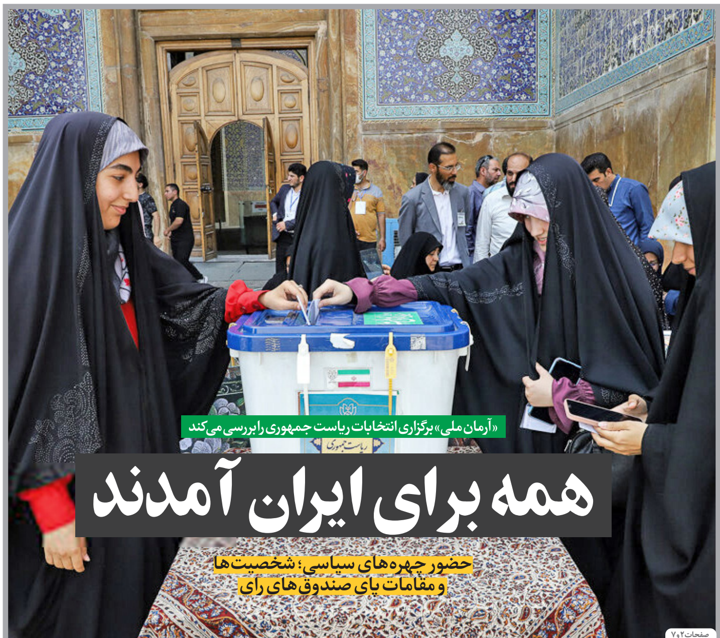
«آرمان ملی» برگزاری انتخابات ریاست جمهوری را بررسی می کند