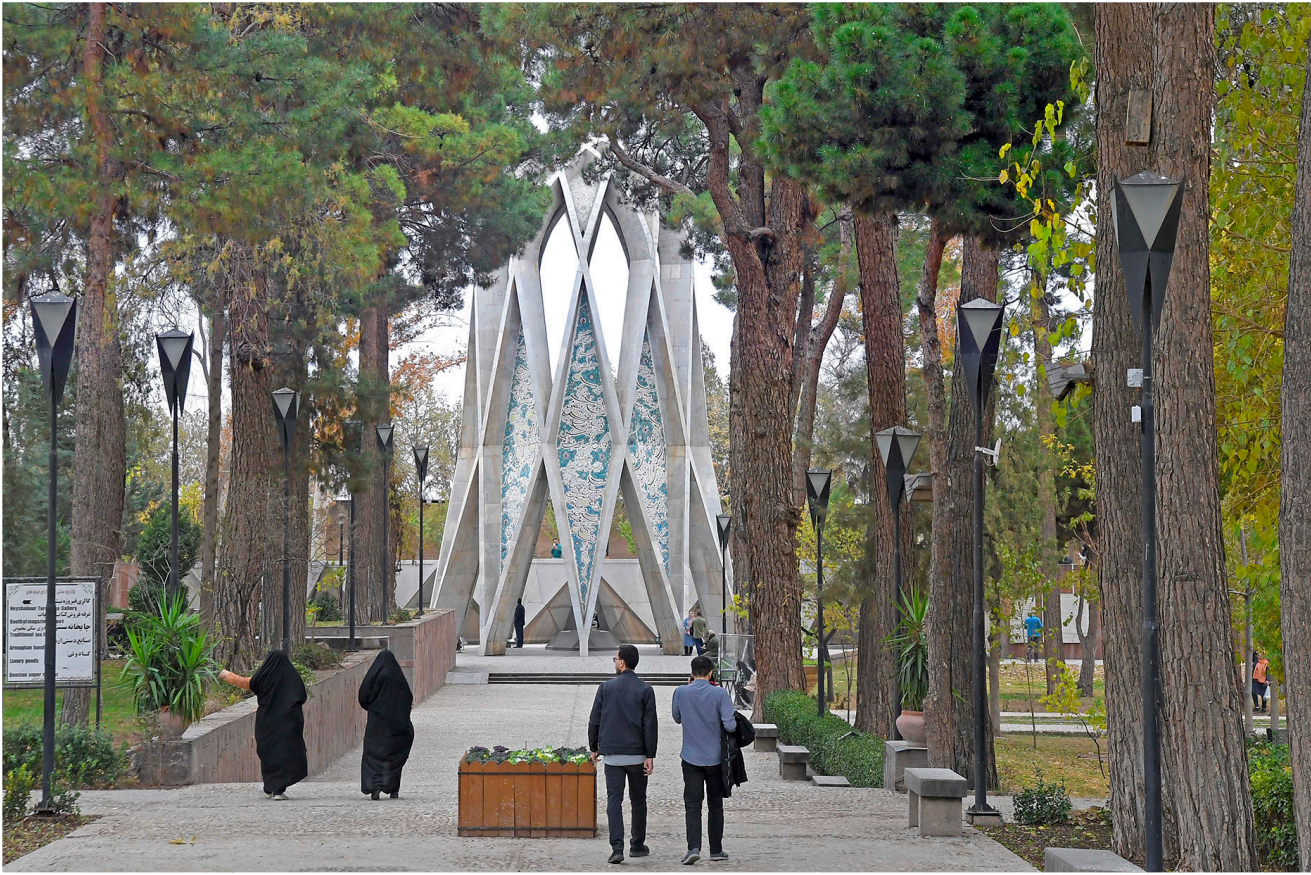
وقتی وارد محوطه ی باغ خیام می شوید دست خودتان نیست، با دیدن مقبره ای سراسر خلایق معماری و شعور سازندگانش شروع می کنی به زمزمه کردن رباعیات عمیق این فیلسوف ریاضی دان روزگارمان. آرام آرام به طرف قبر آرامگاه می زیم. آنهایی که کمتر شعرهایش را در حافظه دارند به راحتی می توانند فقط گوش بسپازند به صدایی که در باغ می پیچد، شعرهایی از خیام و موسیقی دلنشین آن، تا به غمگین گنج نهانی که پیش روی ماست بیندیشیم.