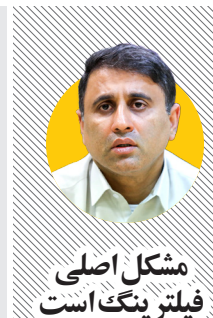
مشکل اصلی فیلترینگ است