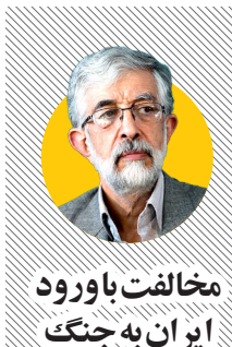
مشکل اصلی فیلترینگ است