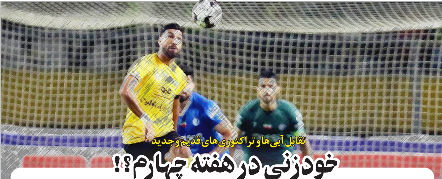
تقابل آبی‌ها و تراکتوری‌های قدیم و جدید

۰۶ ● ۰۶ ● ۰۲ ● ۱۴۰۲ شماره ۱۶۳۳ سال پنجم ۱۱ مهر ۱۳۴۵ / ۲۸ اگوست ۲۰۲۳