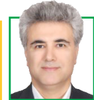
مشکلات دولت چهاردهم و اولویت ها