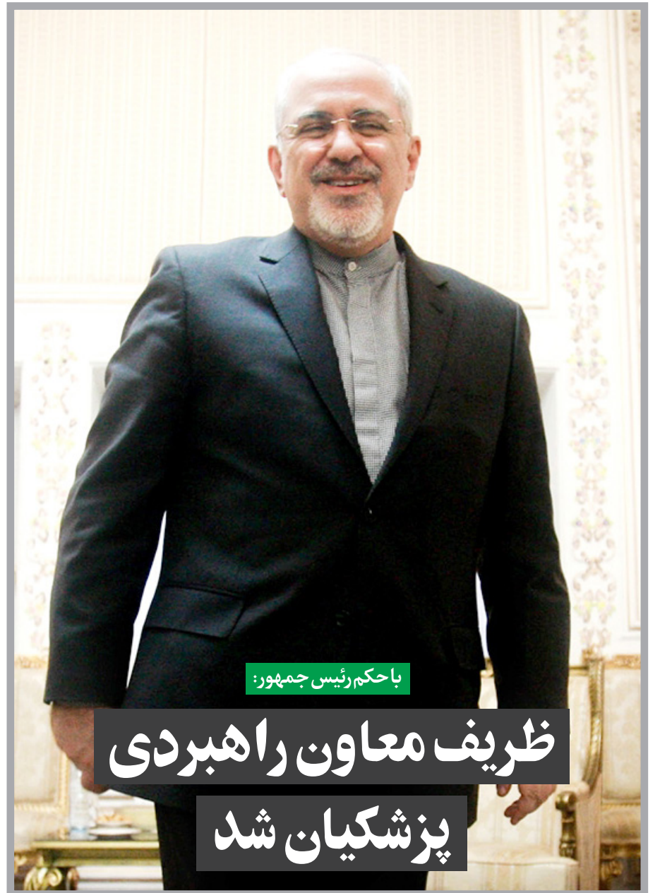
با حکم رئیس جمهور: