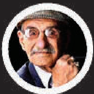
احمد پور مخبر

سال ۱۳۹۹ نسبت به سال‌های گذشته با تفاوت‌های بسیاری همراه بود، با شیوع ویروس کرونا و اوج آن در کشور اتفاقات بسیار ناگواری رخ داد، بسیاری از هموطنان ما به دلیل ابتلاء به این ویروس خطرناک جان خود را از دست داده‌اند. در این میان تعدادی از هنرمندان سینما و تلویزیون هم این یکسال درگذشتند. چهره‌های شاخصی که هنوز باور نبودشان بسیار سخت است.