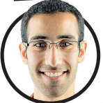
پیام پور فلاح

صاحب امتیاز و مدیرمسئول: حسین عبداللهی زیر نظر شورای سردبیری نشانی: خیابان قائم مقام فراهانی، روبروی تهران کلینیک، کوچه چهارم، پلاک ۲۰، طبقه ۳ تلفن: ۰۲۱۶۶۰۸۸۷۶ / دورنگار: ۸۸۵۴۰۲۴۴ / آگهی ها: ۸۸۷۶۰۲۷۷ چاپ: هشتاد و شش (۳ روز تاپ) ۴۴۵۴۵۰۷۶ توزیع تهران و شهرستان: نشر گستر امروز ۹۱۳۳۳۳۳۳۳۳۳۳۳۳