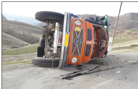
رئیس اداره تصادفات پلیس راهور تهران بزرگ از واژگونی کامیون حمل بار به علت سرعت زیاد در اتوبان آزادگان خبر

داد. سرهنگ احسان مومنی در خصوص جزئیات این حادثه اظهار کرد: در مسیر اتوبان آزادگان مسیر شرق به غرب روبه روی میوه و تره بار نرسیده به پل شهید کاظمی، یکدستگاه کامیون حامل بار واژگون شد. وی افزود: این کامیون به علت سرعت زیاد و عدم توانایی راننده در کنترل وسیله نقلیه ابتدا به سمت راست منحرف شده و پس از برخورد با جداول میانی به لاین کندرو وارد شد. وی گفت: خوشبختانه این کامیون پس از ورود به لاین کندرو با خودروهای عبوری در لاین برخورد نکرد و سایر خودروها پیش از ایجاد برخورد متوقف شدند. مومنی اظهار کرد: بلافاصله پس از این حادثه رئیس و تیم های کارشناسی منطقه ۲۶ پلیس راهور تهران بزرگ در محل حاضر شدند و ضمن ایمن سازی محل حادثه علل و عوامل این