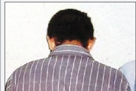
بازدارنده مانند دوربین‌های نظارتی، دزدگیر و همچنین استفاده از سامانه «مها» فرصت ارتکاب جرم را از بین ببرد.

عابر بانک‌شان تماماً در اختیار خودشان بوده است. با کسب این اطلاعات و احتمال اینکه برداشت به شیوه اسکیم انجام شده، رسیدگی به موضوع در دستور کار مأموران پلیس فتا قرار گرفت. وی با بیان اینکه در تحقیقات تکمیلی از مالباختگان مشخص شد که تمامی آنها اخیراً اقدام به سفارش غذا و دریافت آن از پیک موتوری یک رستوران کرده‌اند، گفت: همین موضوع سرخی برای کشف این پرونده شده و مأموران متوجه شدند که مجرم با نصب یک دستگاه اسکیم در دستگاه‌های کارت‌خوان با پوشش پیک موتوری رستوران اقدام به سرقت اطلاعات و کپی کارت بانکی شهروندان کرده است. رئیس پلیس فتای تهران بزرگ با بیان اینکه متهم با کپی کردن اطلاعات کارت بانکی مشتریان مبالغی از ۱۰۰ تا ۵۰ میلیون ریال را از حساب آنان برداشت کرده بود، ادامه داد: سرانجام مأموران موفق به شناسایی این فرد شده و پس از هماهنگی با دستگاه قضائی برای دستگیری او وارد عمل شدند که با دستگیری این فرد، او ابتدا منکر جرم خود شد اما با مشاهده ادله و شواهد موجود لب به اعتراف گشود و به جرم خود اعتراف کرد. گودرزی با بیان اینکه تاکنون دستکم ۲۰ تن از مالباختگان این فرد مورد شناسایی قرار گرفته‌اند، گفت: مجموع برداشت غیرمجاز این فرد از حساب شهروندان بیش از یک میلیارد ریال است. وی با بیان اینکه متهم پس از تشکیل پرونده برای ادامه روند رسیدگی به جرم روانه دادسرا شد، اضافه کرد: راه پیشگیری از چنین اقدامی ساده است، اینکه شهروندان حتماً شخصاً رمز کارت بانکی خود را وارد کرده و از بیان آن به فروشنده هر چیزی کنند.