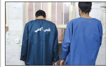
انتظامی لرستان، تصریح کرد: سارقان در تحقیقات صورت گرفته به جرم خود اعتراف و تحویل پلیس تهران بزرگ شدند. سردار مهدیان نسب به شهروندان توصیه کرد: در صورت تردید مشکوک افراد و وسایل نقلیه را بلافاصله از طریق ۱۱۰ به پلیس اطلاع دهند.

فرمانده انتظامی استان لرستان از دستگیری اعضای باند ۳ نفره سارقان منزل که مقادیری طلا، دلار و وجه نقد را به ارزش بیش از ۵۰۰ میلیارد ریال در پایتخت سرقت کرده بودند، خبر داد. سردار حاجی محمد مهدیان نسب اظهار داشت: در پی کسب خبری مبنی بر اینکه ۳ سارق در تهران بزرگ مقادیری طلاجات، دلار و وجه نقد سرقت کرده و در شهرستان دورود مخفی شده‌اند، موضوع به صورت ویژه در دستور مأموران قرار گرفت. وی افزود: مأموران با انجام اقدامات اطلاعاتی ۳ نفر از اعضای باند مورد نظر را در شهرستان دورود شناسایی و دستگیر کردند. فرمانده اطلاع دهند.