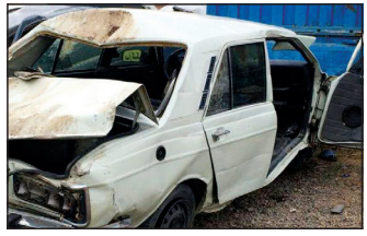
خروج از جاده، خودرو به‌همراه سرنشینان به داخل دره سقوط و ۵ نفر سرنشین آن کشته شدند. این مقام انتظامی با بیان اینکه محورهای مواصلاتی استان به علت ریزش نزولات جوی لغزنده است از رانندگان خواست از هرگونه عجله و شتاب خودداری کنند.

رئیس پلیس راه استان ایلام از وقوع یک فقره واژگونی سواری پیکان در محور ایلام به حمل خیر داد و گفت: در این حادثه ۵ عضو یک خانواده کشته شدند. سرهنگ رضا همتی زاده اظهار داشت: در پی اعلام مرکز فوریت‌های پلیسی ۱۱۰ مبنی بر وقوع یک فقره تصادف در محور ایلام- حمل بلافاصله کارشناسان پلیس راه به محل اعزام شدند. وی افزود: با حضور کارشناسان در محل، مشخص شد یک دستگاه خودروی پیکان با ۵ سرنشین به علت خستگی و خواب‌آلودگی از جاده منحرف و واژگون شده است. رئیس پلیس راه استان یادآور شد: بر اثر این واژگونی و خروج از جاده، خودرو به‌همراه سرنشینان به داخل دره سقوط و ۵ نفر سرنشین آن کشته شدند. این مقام انتظامی با بیان اینکه محورهای مواصلاتی استان به علت ریزش نزولات جوی لغزنده است از رانندگان خواست از هرگونه عجله و شتاب خودداری کنند.