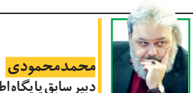
محمد محمودی دبیر سابق پایگاه اطلاع رسانی آیتا... هاشمی