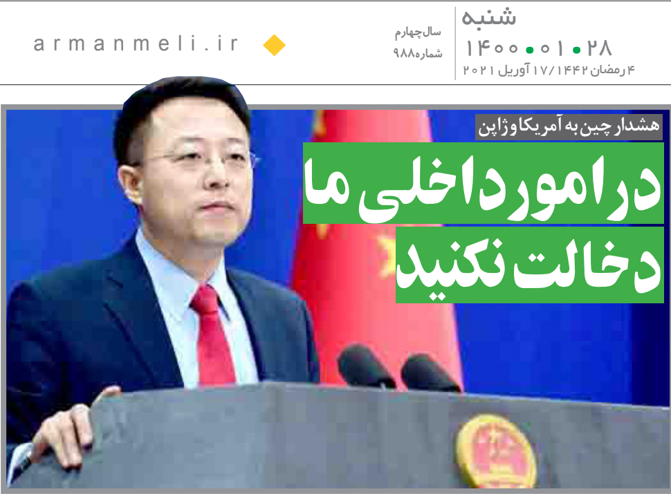
هشدار چین به آمریکا و ژاپن

نتایج یک نظرسنجی نشان داد مارکوس سویدر، باورایی در رقابت در بلسوک محافظه کار حاکم بر آلمان بر سر کسب نامزدی این بلوک برای صدر اعظمی در آستانه برگزاری انتخابات سپتامبر، محبوبتر از رقیبش یعنی آرمین لاشت است. به گزارش خبرگزاری رویترز، در حالی که آنگلا مرکل، صدر اعظم آلمان از حزب دموکرات مسیحی (CDU) قرار است بعد از انتخابات کنار برود فشاها بر بلوک حاکم بر آلمان به منظور توافق کردن بر سر یک کاندیدای صدر اعظمی به دنبال پایین آمدن میزان تایید عملکرد آن در طی یک سال گذشته افزایش یافته است. دولت آلمان هم اکنون در گیر مهار همه گیری کووید ۱۹ در ضمن شیوع هر چه بیشتر یک سویه مسری تر این ویروس در سراسر آلمان است. رقابت میان آرمین لاشت، رئیس حزب دموکرات مسیحی و سویدر، رئیس حزب خواهر باورایی آن یعنی حزب اتحاد سوسیال مسیحی (CSU)، به سطح یک اختلاف مشخص رسیده است. یک نظرسنجی انجام شده از سوی ARD Deutschlandtrend مشخص کرد که ۴۴ درصد رای دهنندگان آلمانی و ۷۲ درصد حامیان بلوک CDU/CSU، سویدر را کاندیدای مناسبتر برای صدر اعظمی می دانند. در مقابل تنها ۱۵ درصد آلمانی‌ها و ۱۷ درصد حامیان بلوک CDU/CSU فکرمی کنند که لاشت، وزیر اول ایالت راین شمالی - وستفالن، کاندیدای مناسبتری برای این سمت است. سویدر که عمدتاً در خاطر غرور، اعتماد به نفس و صریح بودنش نزد رای دهندگان محبوبیت بیشتری دارد به دنبال این بوده که محبوبیتش را تبدیل به یک فاکتور قاطع در رقابت کند.