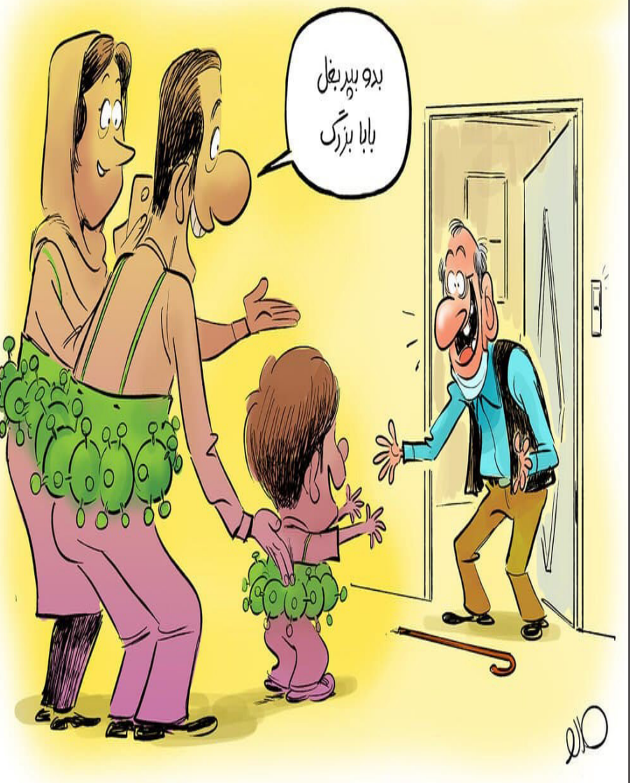
منبع: خبر آنلاین

حریر چی، معاون وزیر بهداشت گفته: «ناقصان فر نطنینه مانند ترور بست انتحاری هستند»