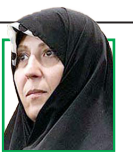
فاطمه هاشمی رفسنجانی