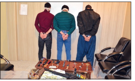
گفت: سامانه ۱۹۷ پلیس نیز آماده دریافت هرگونه انتقاد و پیشنهاد و تقدیر از عملکرد نیروی انتظامی از سوی شهروندان است.

با موارد مشکوک آن را از طریق سایت پلیس فتا به آدرس www.cyberpolice.ir بخش مرکز فوریت‌های سایبری گزارش کنند و همچنین شهروندان به صورت ۲۴ ساعته می‌توانند با شماره تلفن ۰۹۶۳۸۰ مرکز پاسخگویی فوریت‌های سایبری پلیس فتا در ارتباط باشند.