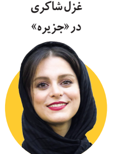
غزل شاکری در «جزیره»