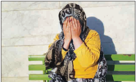
داده‌اند و با همکاری همدست دیگرشان که خانم میانسالی است طلا و سکه خریدانه که این زن نیز در حوالی سیدخندان دستگیر شد.

زنی که در یکی از طلافروشی‌ها حضور داشتند، شده و پیش از هر اقدامی آنها را دستگیر کردند. سرهنگ یاری ادامه داد: دیگر اعضای باند هم در اعتراضات خود عنوان کردند در روزهای ۶ خرداد حلقه انگشتر به وزن تقریبی ۴۰ گرم و به ارزش حدود ۵۰۰ میلیون ریال سرقت کرده‌اند که ماموران در بازرسی از مخفیگاه آنها موفق به کشف طلاهای مسروقه و همچنین چند عدد انگشتر بدلیجات شدند. فرمانده انتظامی اسلام‌آبادغرب در پایان با اشاره به تحویل انگشترهای سرقتی به صاحبان آنها، از معرفی سارقان دستگیر شده به دستگاه قضائی جهت صدور احکام لازم خبر داد.