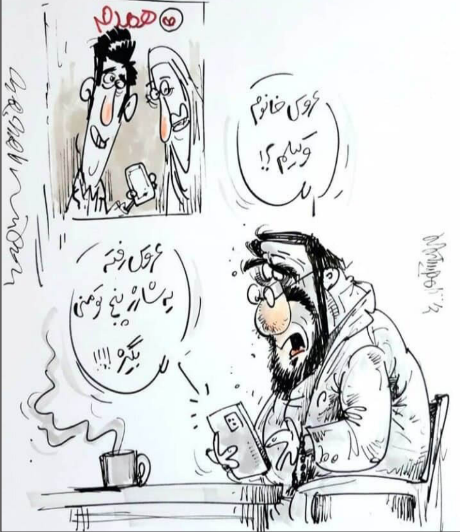
متنوع: اینستاگرام کاتونیست