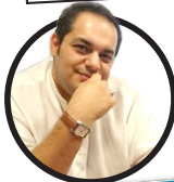
محمد رضا میر شاه ولد

نشانی اینترنتی: www.armanmeli.ir آیین نامه اخلاق حرفه ای روزنامه آرمان ملی را در سایت بخوانید