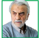
سیدمصطفی هاشمی طبا