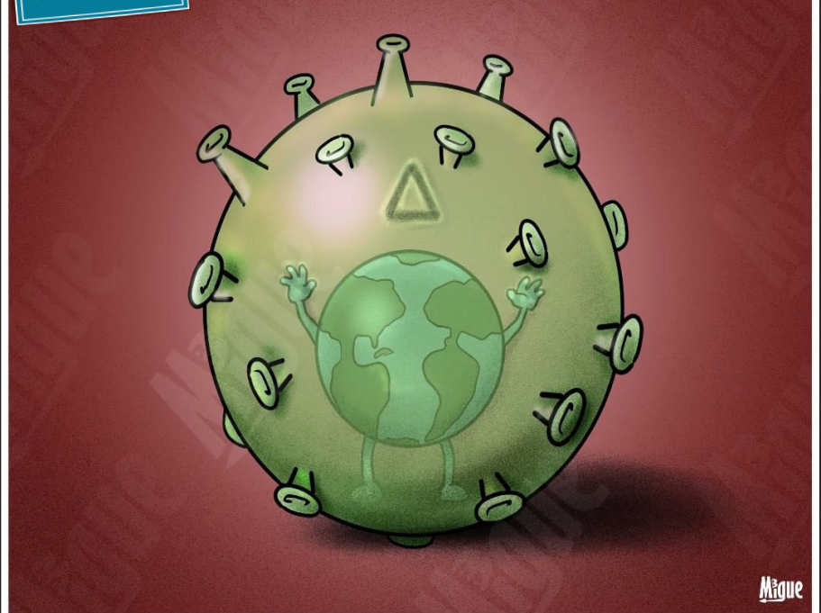
دلنا ویروس کرونا، ویرانگر جهان | میگل مورالس مادرینگال